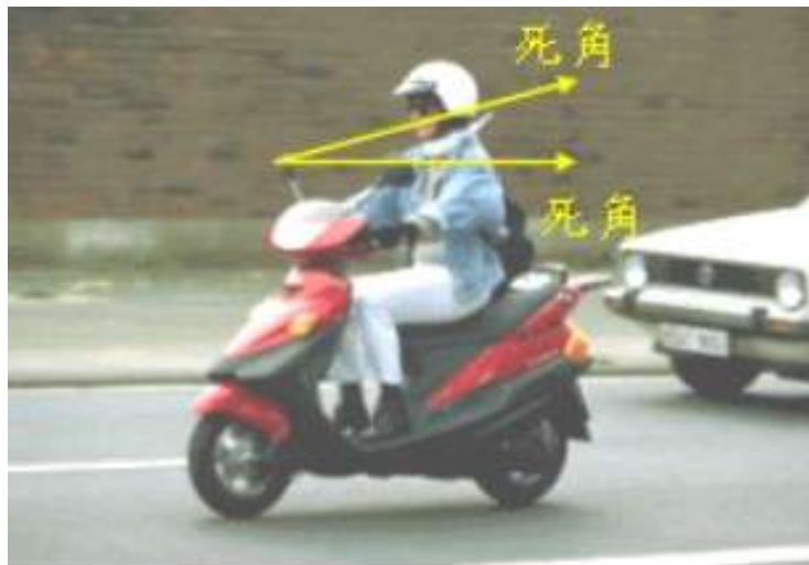
圖5 機車後照鏡的死角