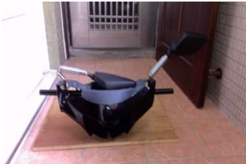
圖16 伸縮後照鏡模型

本組將後照鏡切斷，在與我們製作鐵的伸縮管結合的，右邊能伸縮，但左邊的可以往內凹放在儀表板上面，儀表板有海綿墊著不會受到後照鏡得衝擊，而不會使後照鏡或儀表板損壞或破裂。