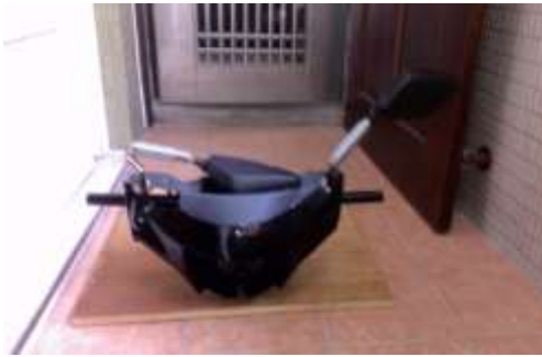
圖14 伸縮後照鏡成品