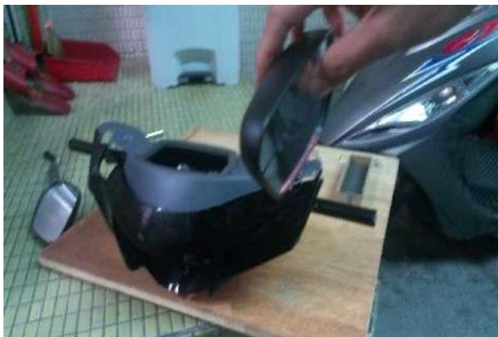
圖 13 鎖上後照鏡