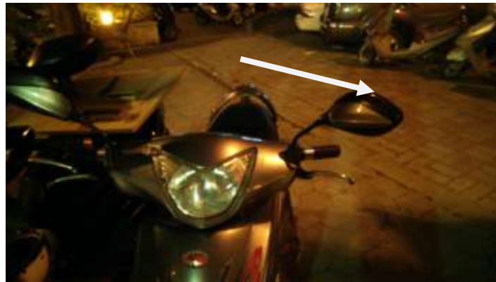
圖7 停車時後照鏡相撞的情形

(二)後照鏡停車時的不便:有些人停機車時都會硬擠，造成後照鏡想狀或損壞，也會造成人行走而勾到後照鏡而摔倒