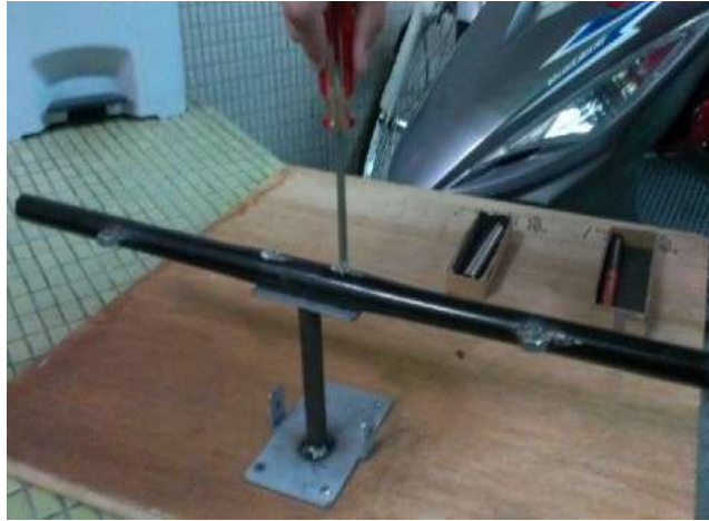
圖 11 將手把鎖緊