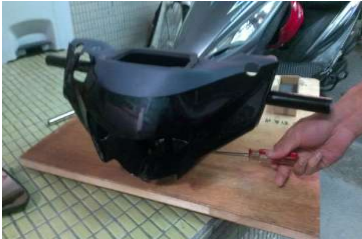
圖12 將龍頭外殼鎖上