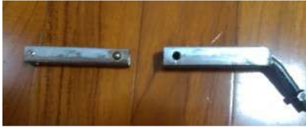
圖 8 伸縮後照鏡