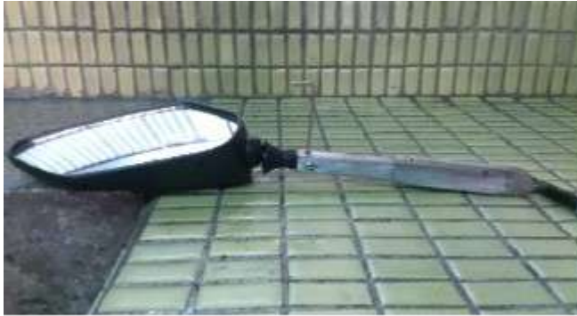
圖 9 伸縮後照鏡