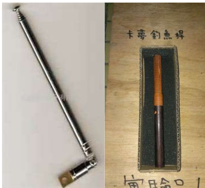
圖2 天線與卡夢釣魚竿